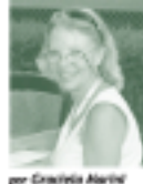
por Graciela Mañé

ganó el 1ER PREMIO (o sea para mí mismo). Los europeos juegan permanentemente en circuitos de cada país, me daba cierto sabor que nosotros conocíamos muy bien en Buenos Aires, ellos deben trasladarse permanentemente. Hay premios en Euro que supongo es para pelear tanto trabajo.